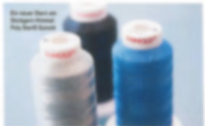
Das neue Garn aus Dusterlike Duster-Faser